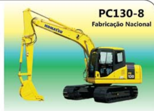
PC130-8 Fabricação Nacional

Porto Alegre/RS | Fone/Fax: 55 (51)3362-5039 Farroupilha/RS | Fone/Fax: 55 (54)2109-5399 mantomac.com.br